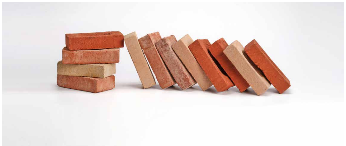
Secundaire grondstoffen (strategie 6): CicloBrick

Het ontwerpen met secundaire grondstoffen draait om de inzet van eerder gebruikte grondstoffen en materialen of reststromen van een ander productsysteem. De secundaire grondstoffen vervangen primaire grondstoffen en dragen zo bij aan bescherming van grondstofvoorraden. Voordeel van baksteen is dat de primaire grondstof klei ruim voorradig is en rivierklei bovendien ook nog eens hernieuwbaar. Maar duur-