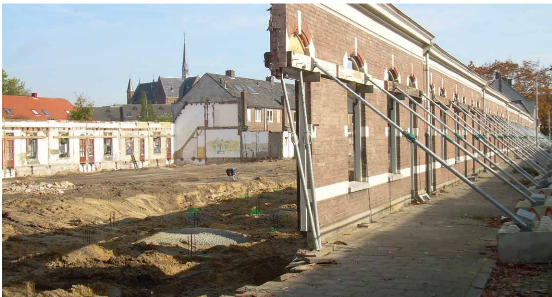
Hergebruik delen van bouwwerken (strategie 5): Alleen de voorgevel in Nijmegen is behouden

zaamheid kan altijd nóg beter. Diverse reststromen vanuit andere productsystemen vinden hun weg naar de baksteenindustrie. Gebruikt keramiek kan prima als secundaire grondstof worden toegepast bij de productie van nieuwe keramische producten. Het secundair materiaal moet wel voldoende beschikbaar en homogeen zijn en de vervoersafstanden niet te groot. Enkele fabrikanten bieden gevelbakstenen aan met een hoog gehalte recycled content.