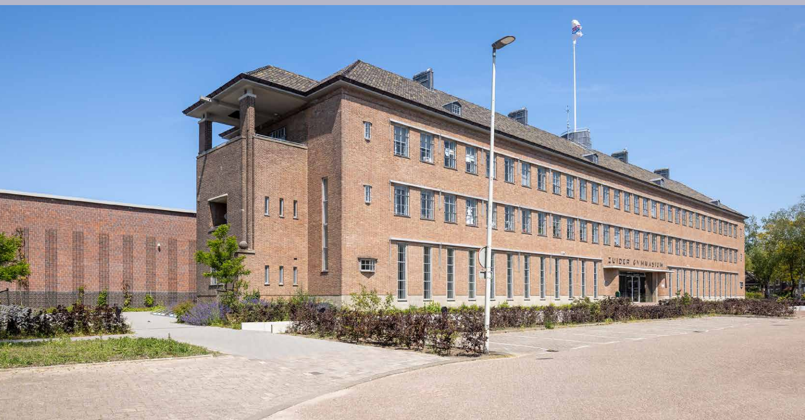
Hergebruik van oud gebouw: Zuider Gymnasium Rotterdam, verbouwing van ziekenhuis tot gymnasium, winnaar Rotterdam Architectuurprijs 2023, Molenaar & Co architecten (Strategie 1: preventie, voorkomen)