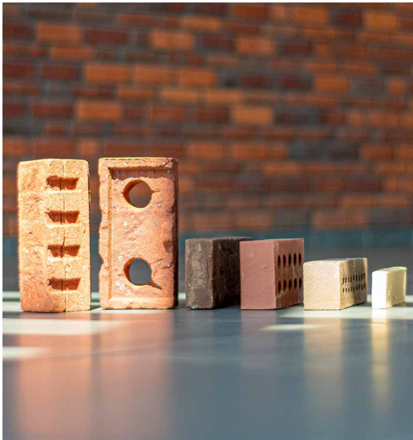
Dematerialisatie (strategie 1: optimaliseren) en droogstapelstenen (strategie 4: losmaakbaarheid en herbruikbaarheid)

Bij ontwerpen voor kwaliteit en onderhoud staat de toekomstwaarde en realisatie van een door de gebruikers hooggewaardeerd gebouw met een lange levensduur en weinig onderhoud centraal. Het ontwerp richt zich op hoogwaardige kwaliteit en esthetiek en de toepassing van robuuste onderhoudsarme producten en goede detailleringen. Een langere functionele levensduur van een bouwwerk pakt positief uit wanneer de gebruikte bouwproducten een zeer lange technische levensduur hebben. Vervanging is daardoor immers niet nodig. Baksteen heeft een lange levensduur, is onderhoudsarm en beschermt objecten tegen weer en wind. Ook de term 'koestering' speelt een grote rol: bouwwerken waar belanghebbenden aan hechten, blijven langer in gebruik. De ontwerp mogelijkheden met baksteen zijn onuitputtelijk. Als frequent veranderingen in gebruikseisen te verwachten zijn, is een combinatie met Ontwerpen voor adaptiviteit en Ontwerpen voor losmaakbaarheid en herbruikbaarheid noodzakelijk.