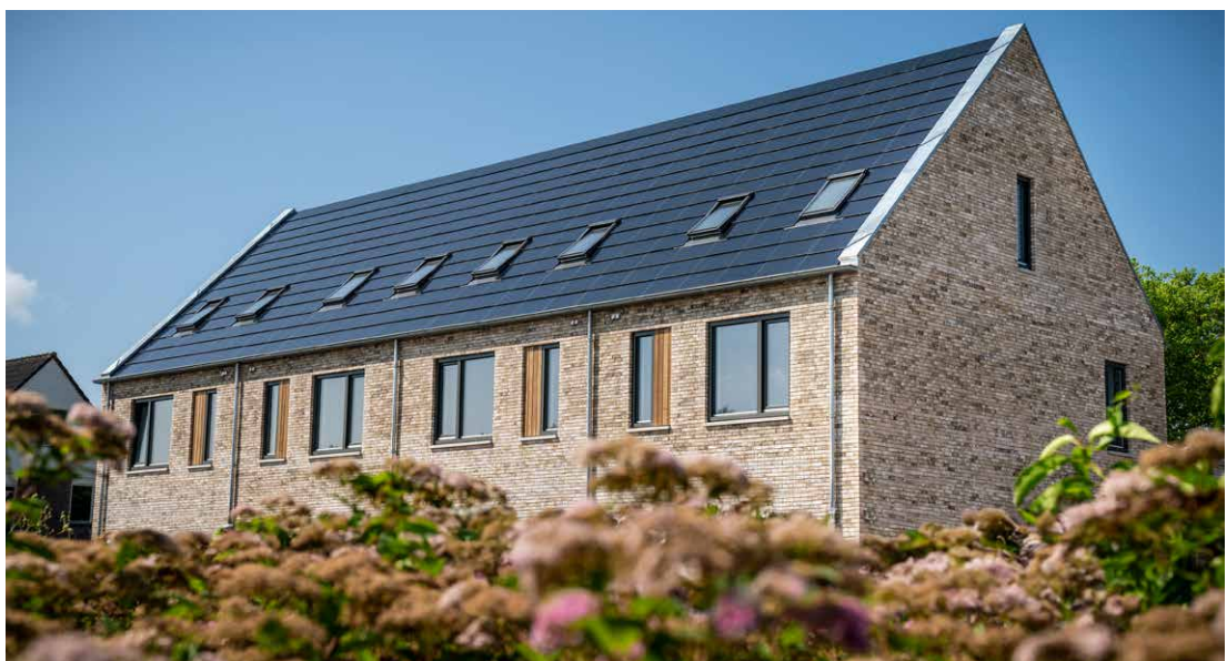
Woningen Ameide (strategie 2: ontwerpen voor kwaliteit en onderhoud)

Een hernieuwbare grondstof wordt geteeld, natuurlijk aangevuld of natuurlijk gereinigd op een menselijke tijdschaal. Een hernieuwbare grondstof kan van zowel abiotische als biotische oorsprong zijn. Voorbeelden van hernieuwbare hulpbronnen zijn: bomen in bossen, grassen in grasland, schelpen en klei uit de Nederlandse rivierdelta (sedimenten). Het gebruik van baksteen gemaakt van rivierklei valt onder deze strategie omdat klei continu via de rivieren wordt aangevoerd en afgezet in de uiterwaarden. Dit is ook vastgelegd in de CB'23 leidraden, de Handreiking Circulaire Gebouwen Milieulijst 2023 van de Rijksdienst voor Ondernemend Nederland en het in opdracht van de Nationale Milieudatabase in januari 2023 gepubliceerde Agrodome-rapport 'Hernieuwbare grondstof en materiaal voor de bouw'.